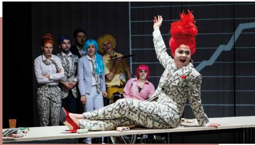
»Alles was zählt – Lieder von Geld und Schulden« Liederabend | Schauspiel Frankfurt | © Jessica Schäfer