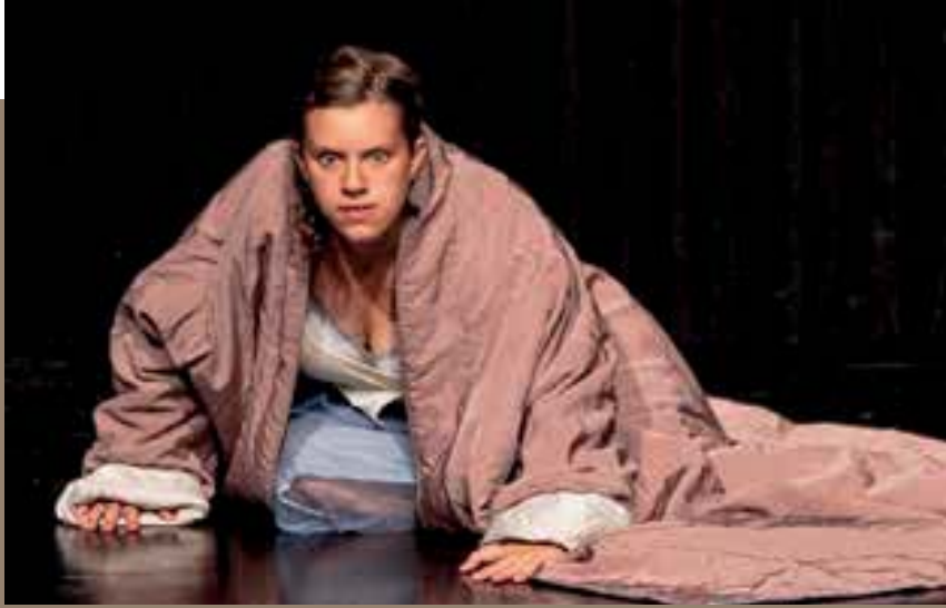
Objektetüde Physiodrama | HfMDK Frankfurt am Main