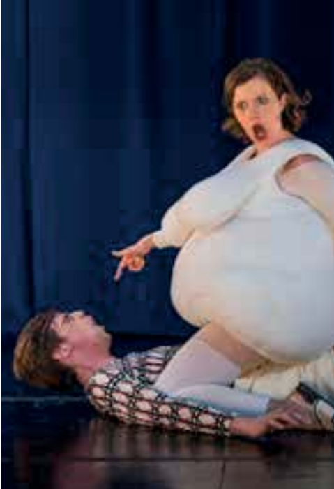
»Einige Nachrichten an das All« Wolfram Lotz | Schauspiel Frankfurt | Die Dicke Frau