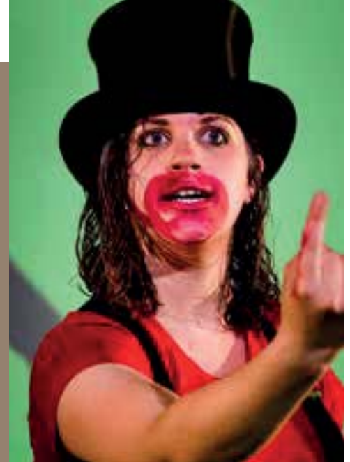
»Ein Bericht für eine Akademie« Franz Kafka Schauspiel Frankfurt | Rotpeter